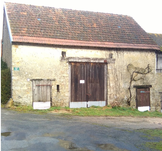
La grange de madame Labrousse