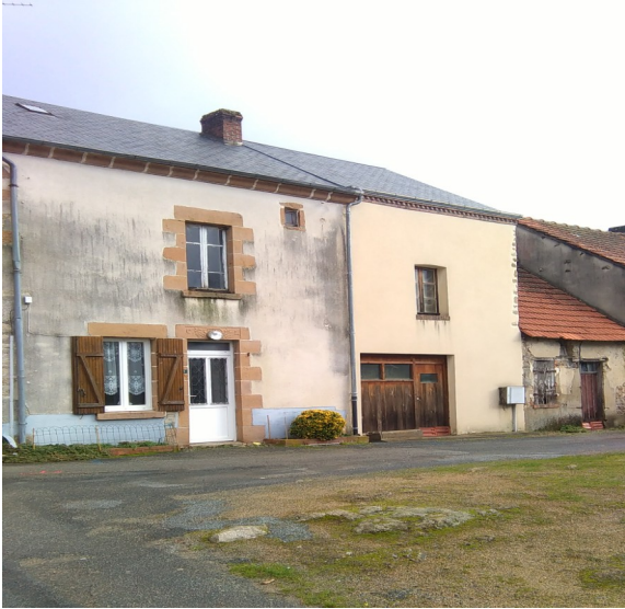
La maison de madame Labrousse