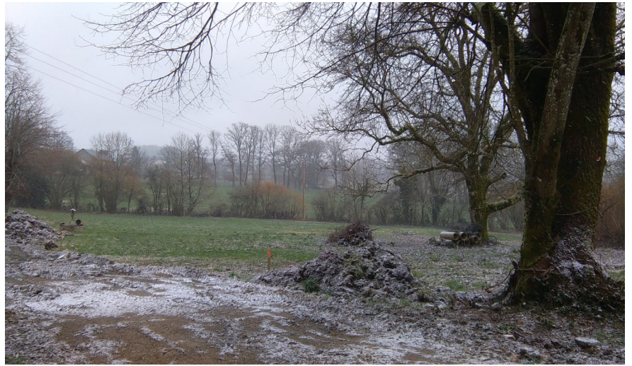
Le terrain de madame Labrousse (futur lotissement)