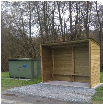
L'abribus de Brézenty