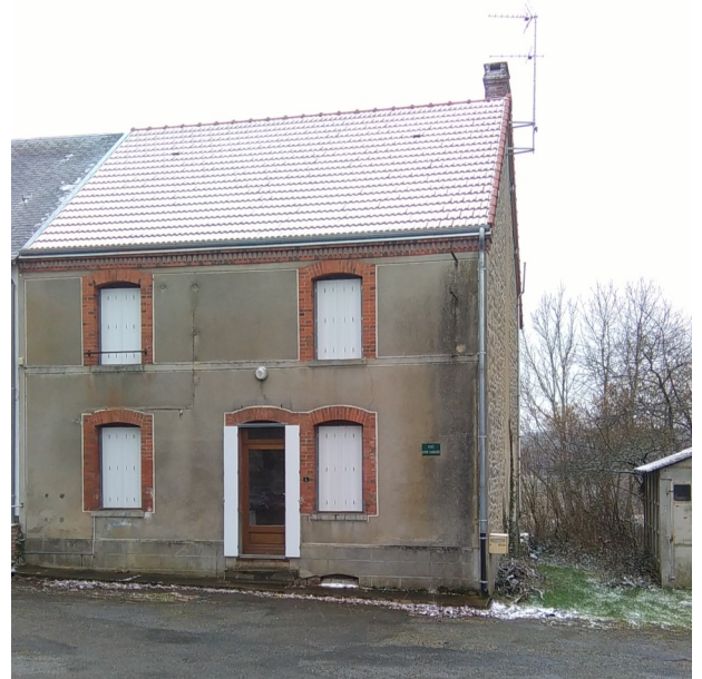
logement communal 4 place Henri Gagnadre